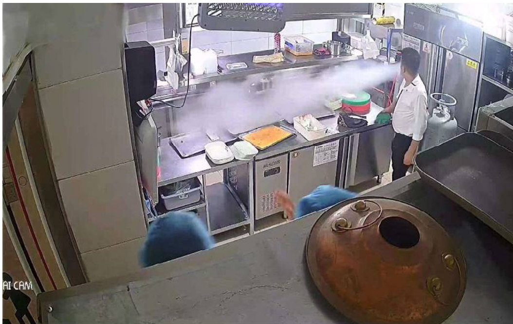
图 3 涉事气瓶泄漏时的厨房监控画面