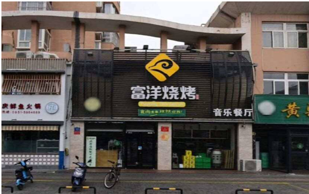
图 1 事发前富洋烧烤店照片